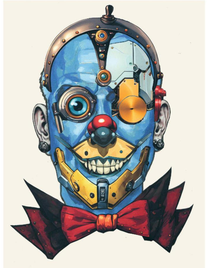
'Collage 6'. | Foto's: Remigius

Remigius, 'De Samenvatting van mijn EGO', tot en met zondag 28 juni, Haagse Kunstkring, Denneweg 64. Meer informatie: www.haagsekunstkring.nl en www.remigius.eu